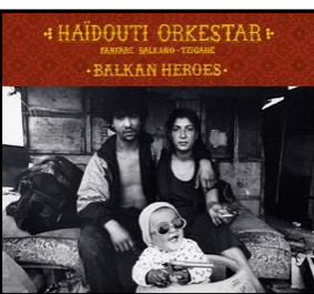
Balkans heroes (Tchekchouka / L'Autre Distribution) 2007