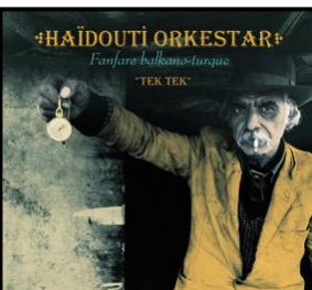
Tek Tek (Tchekchouka / L'Autre Distribution) 2009