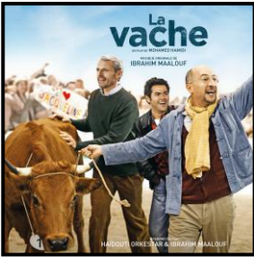
Soundtrack of the movie "La Vache" (Harmonia Mundi) 2016