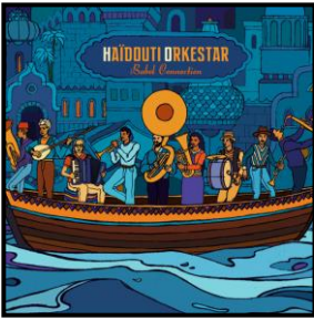
Babel Connexion (L'Autre Distribution) 2017