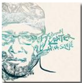
An Ka Sonjé (Heavenly Sweetness) 2018