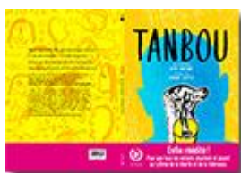
Tanbou CD Livre (Seuil Jeunesse) 2000