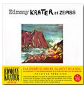
Tijan pou Velo (Heavenly Sweetness / Digger's Digest) 1988 réédité en 2016