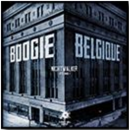
Nightwalker Vol.1 (Dusted Wax Kingdom) 2013