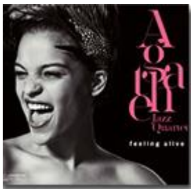
Feeling Alive (Neuklang, 2015)