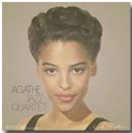
Vinyl collector (2014)