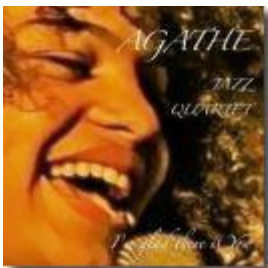
EP I'm Glad There is You (2007)