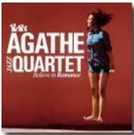
EP Believe in Romance (2010)